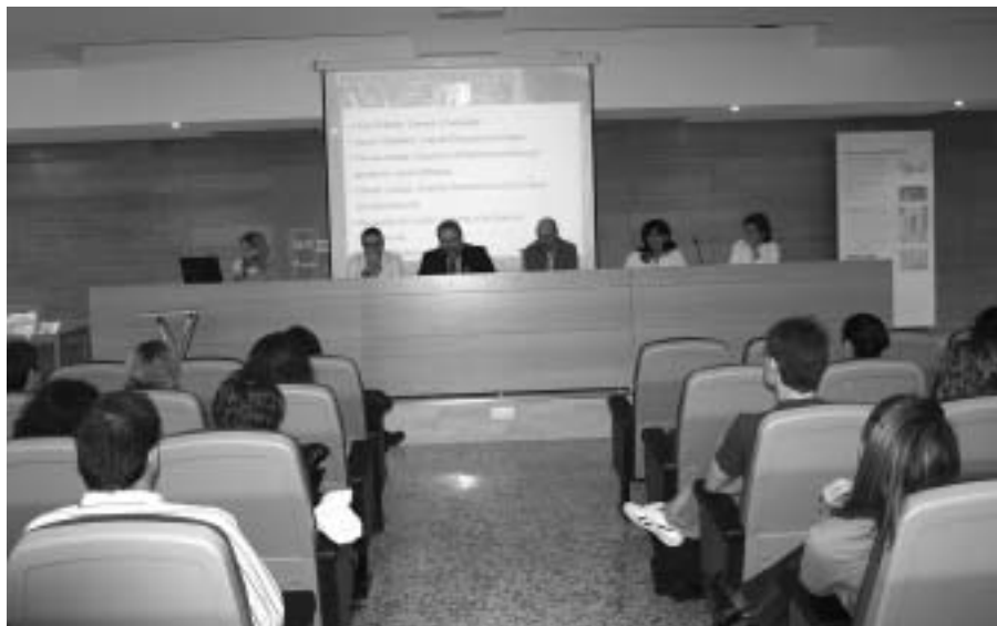
Acte de benvinguda als residents de l'IAS.