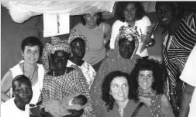
Fotos cedides pel grup de participants en un projecte de cooperació a la Casamance ( Senegal) que tenia per objectiu contribuir a la reducció de la morbimortalitat materna.