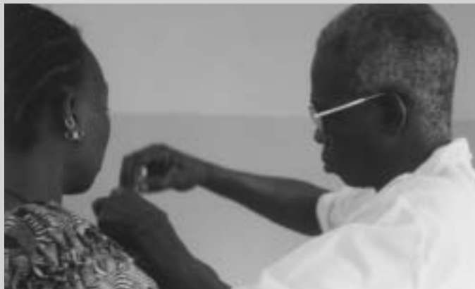
de la seva experiència en el projecte de cooperació sanitària als dispensaris de salut locals de Thies, Senegal.