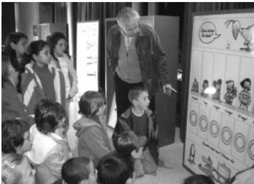
Escolars de segon i tercer curs de primària de l'escola Juncadella de La cellera de Ter en el seu pas per l'exposició.

Els alumnes de les diferents escoles de les comarques del Gironès i la Selva han pogut visitar i participar d'aquesta exposició des del dia 7 a l'11 d'abril a les Bernardes de Salt i, des del 14 al 18 d'abril, al Teatre de Vidreres.