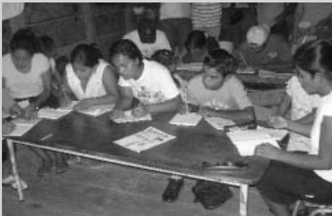
Imatge cedida per Pilar Parra, cooperant del projecte Raan, Nicaragua.