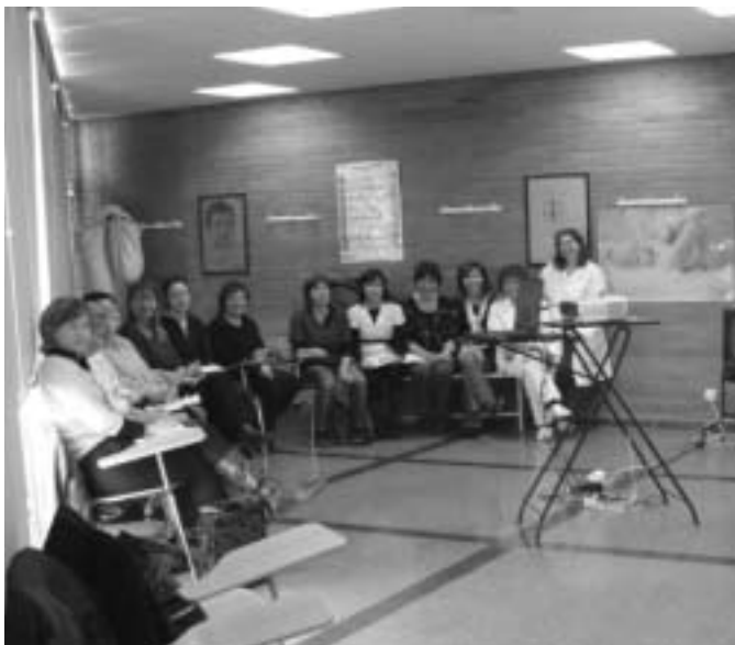
Les diferents sessions es van dur a terme en les ABS d'Anglès i de Cassà de la Selva.

Des de principis d'any i fins el mes de març les llevadores de l'IAS han impartit a un grup d'auxiliars d'infermeria formació en ginecologia i obstetrícia centrada en proves ginecològiques, infeccions de transmissió sexual i seguiment de l'embaràs.