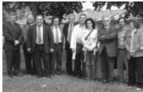
Visita del Govern andorrà a les instal·lacions de l'IAS