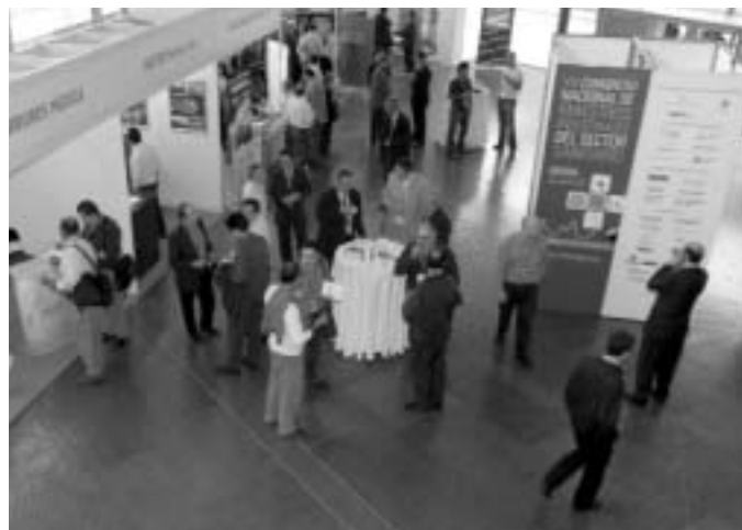
El Congrés va comptar amb una gran exposició comercial al hall de l'auditori.