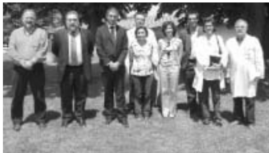
Visita del delegat del Govern a l'IAS.