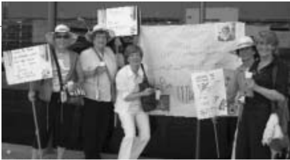
A dalt, comiat de la Margarita a l'aeroport. A la dreta, festa de comiat organitzada el 13 de juny pels companys de l'IAS.