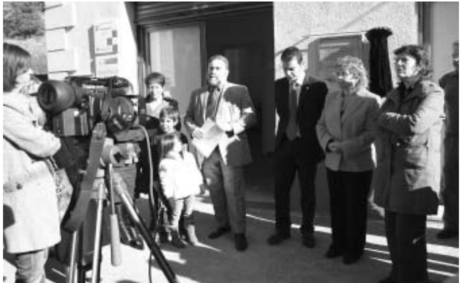
Detall del moment dels parlaments de l'acte inaugural del nou CAS a Ripoll.

Les funcions del CAS, en el marc de la prevenció, assistència i tractament de les drogodependències,