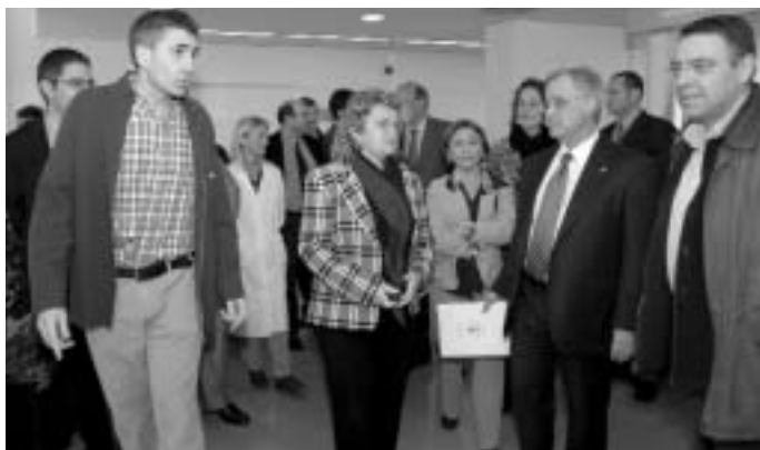
Inauguració del Cap de Blanes. La direcció i professionals de l'IAS amb la consellera Marina Geli en diferents moments de l'acte inaugural.