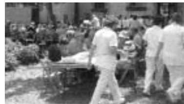
L'arrossada es va celebrar el 18 de juny per celebrar amb els usuaris l'arribada de l'estiu.

Un any més, el Servei de Psicogeriatria de l'IAS va organitzar als jardins del Parc Hospitalari Martí i Julià l'esperada arrossada per als seus usuaris. De primer, gazpatxo; de segon, la paella —a càrrec dels Arrossaires de l'Argelaguer— i, després del cafè i del gelat, d'un ball amenitzat pel conjunt Sween Dreams .