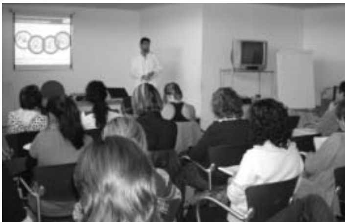
Un moment d'unes de les sessions.

Des de principis d'any, l'IAS és un centre acreditat per la Generalitat de Catalunya per a la formació de Suport Vital Bàsic amb Desfibril·lador Extern Automàtic (DEA). L'IAS junt amb l'Escola Universitària d'Infermeria de Girona i l'Hospital de Puigcerdà són els únics centres acreditats de la província en oferir aquesta formació.