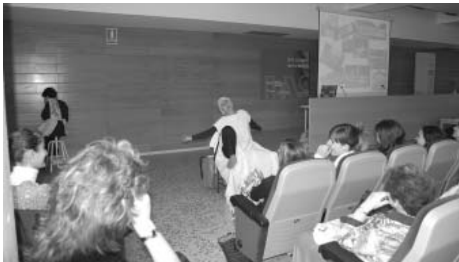
Assistents durant l'obra de teatre Nacido en casa .