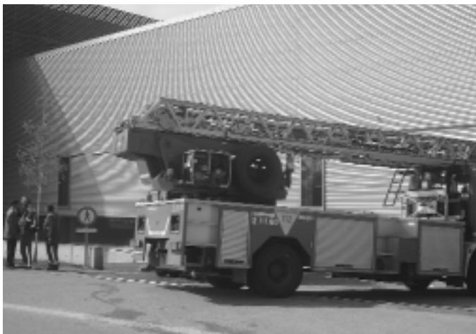
Imatge d'un dels moments previs a la intervenció de l'emergència.