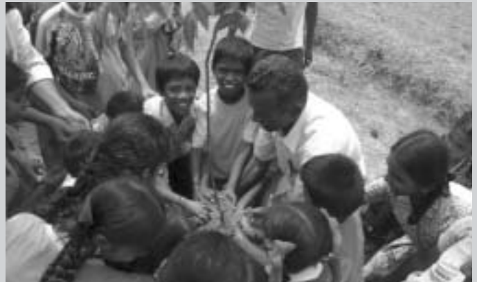
Imatge cedida per Elisenda Castanys, cooperant de l'Associació Dil Se, organització que treballa en projectes sociosanitaris al sud de la Índia.