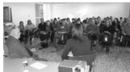
Un moment de la jornada.

El Pla estratègic de l'IAS 2006-2010 contempla una línia estratègica que incorpora oficialment el concepte Responsabilitat Social Corporativa (RSC) en el model de gestió de l'organització. Aquesta línia implica l'aplicació de l'RSC a diferents àmbits i, entre aquests, es troba la cooperació internacio-