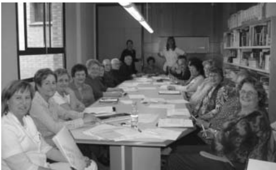
Moment d'una de les sessions.

El mes de març les infermeres de l'ABS d'Anglès van organitzar un taller de memòria adreçat a persones de 60 o més anys, sense trastorns cognitius i amb la percepció subjectiva de pèrdua de memòria. L'activitat va constar de vuit sessions de noranta minuts cadascuna on s'oferien tècniques de memòria que després es posaven en pràctica a través de diferents exercicis.