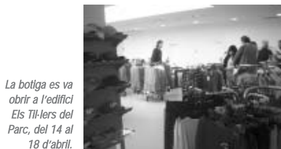
La botiga es va obrir a l'edifici Els Tilers del Parc, del 14 al 18 d'abril.