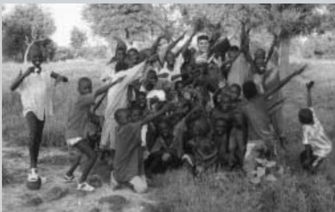
Dues imatges del poble de Sitacourou, Senegal, cedides per Sana Kane.