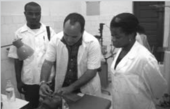
Dues imatges cedides per Estel Roig, cooperant d'Òptics pel Món.