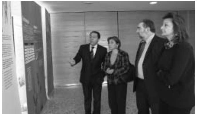
Visita a l'exposició.

L'IAS va acollir, el passat 25 de març, a l'Hospital Santa Caterina, l'exposició i jornada La salut de les poblacions amb menys recursos , organitzades per la Fundació per al Desenvolupament de la Infermeria (FUDEN).