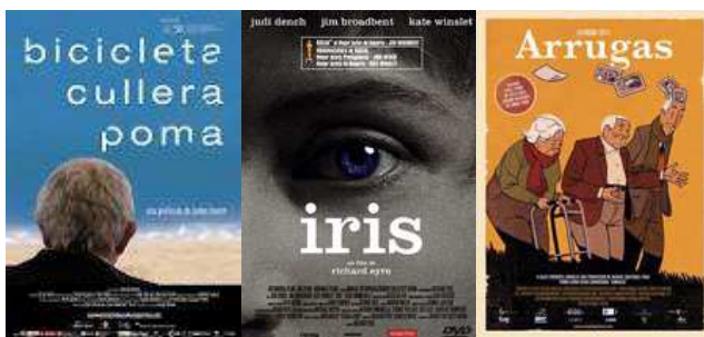
Imatge 1. Cartells de les pel·lícules documentals.

Hi ha films, com "IRIS" (2001) que explica la història real entre la novel·lista britànica Iris Murdoch amb MA i el seu marit, on costa distingir entre ficció i no ficció. A Catalunya tenim recent encara el documental "Bicicleta, cullera, poma" (2010) que mostra el procés diagnòstic i la fase inicial de la MA del polític català Pasqual Maragall o la pel·lícula d'animació "Arrugas" (2011), extreta del còmic amb el mateix nom, que reflexa la vida en un residència geriàtrica des de la perspectiva de qui hi ha d'anar a viure.