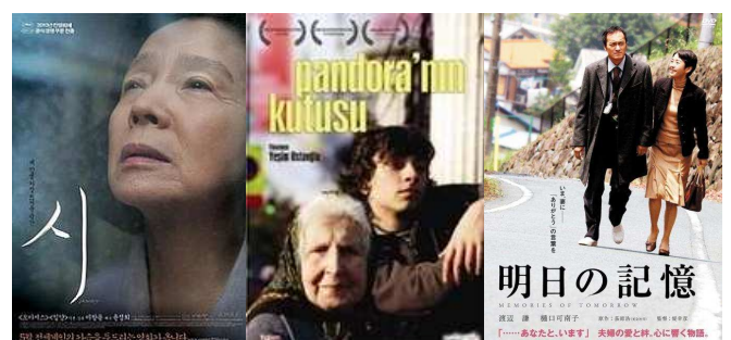
Imatge 2. Films amb contraposició cultural.

Pel·lícules com el "El hijo de la novia" (2000-Argentina), "Jodaeiye Nader Az Simin" (2011-Iran) o "Pandora'nin kutusu" (2008-Turquia), permeten comprovar la universalitat de la demència i les diferències segons contextos culturals. "Memories of Tomorrow" (2006) és una pel·lícula japonesa on destaca la visió del propi protagonista (pacient) o "A moment to remember" (2004) exposa les dificultats en el context de Corea del Sud. "Black" (2005) és un film de la Índia que contraposa una mirada positiva de la MA i "Poetry" (2010) dota de versos la pèrdua.