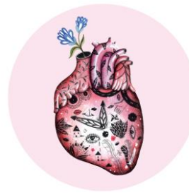
Il·lustració de l'artista Wäwä dins l'exposició La mort digna il·lustrada .

La llei orgànica de regim especial (LORE) 3/2021 regula el dret que correspon a tota persona que compleixi amb les condicions exigides a sol·licitar i rebre la ajuda necessària per morir, el procediment que ha de seguir-se i les garanties. Alhora, regula els deures del personal sanitari que atengui a aquestes persones.